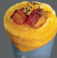
Sweet Potato 蜜芋 1190